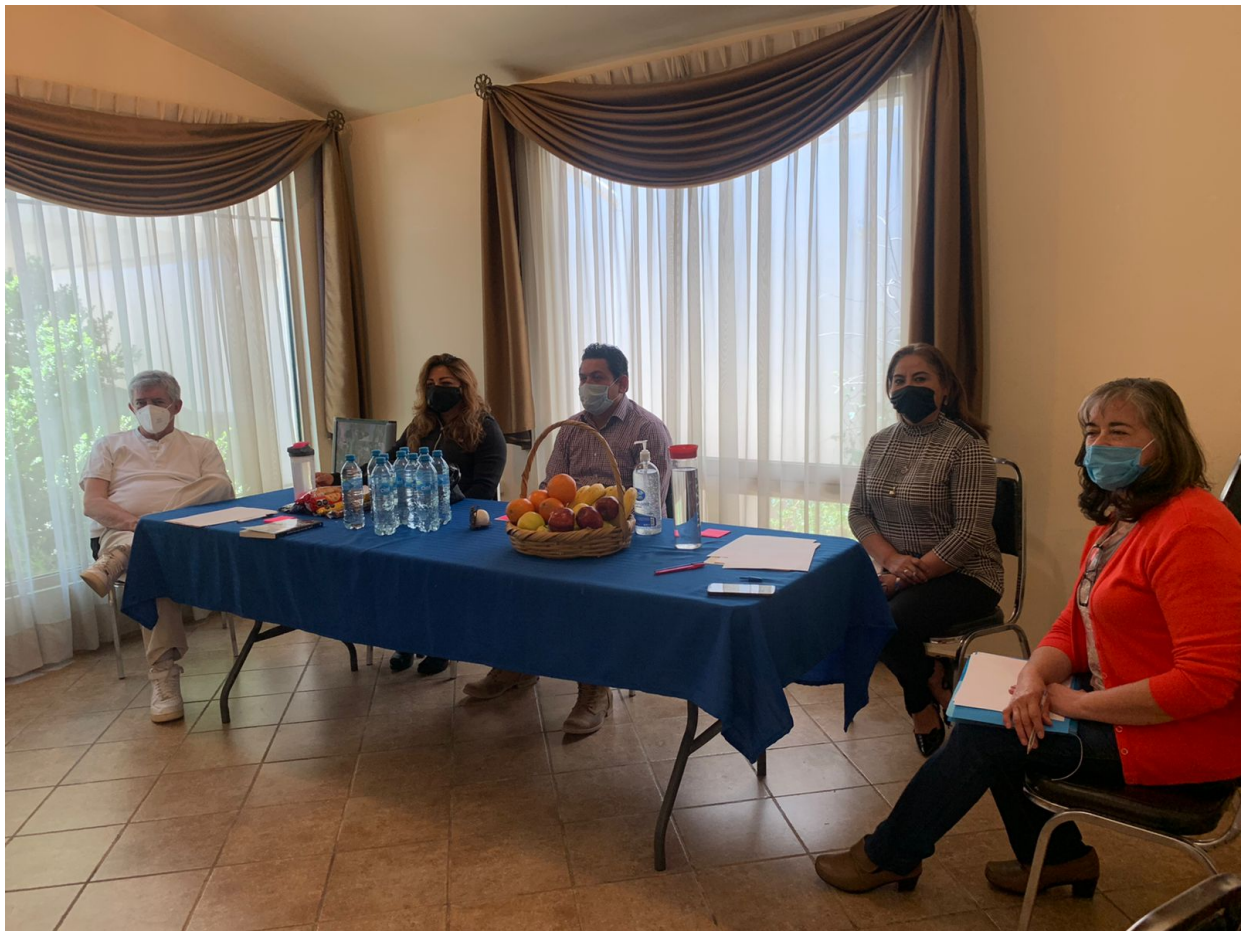
Casa Tseyor Saltillo. México. Jornada de Puertas abiertas en tiempos de contingencia.