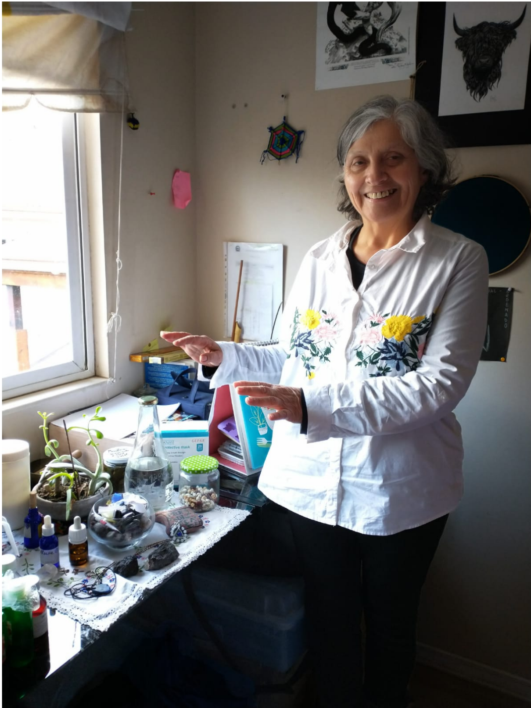
Priora Predica Corazón Pm