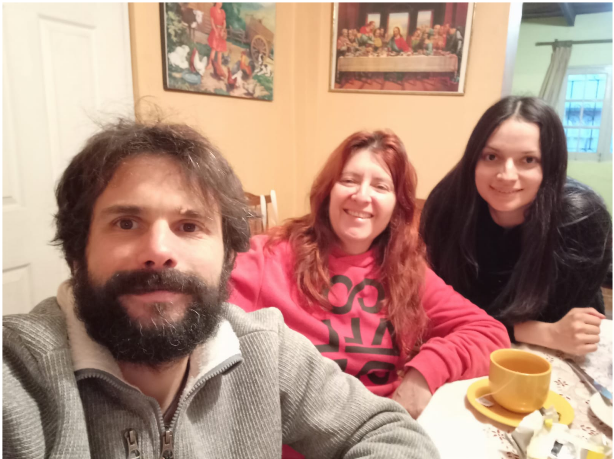
PIGMALIÓN, CAPITEL PI PM y ROJO AL AMANECER LA PM.