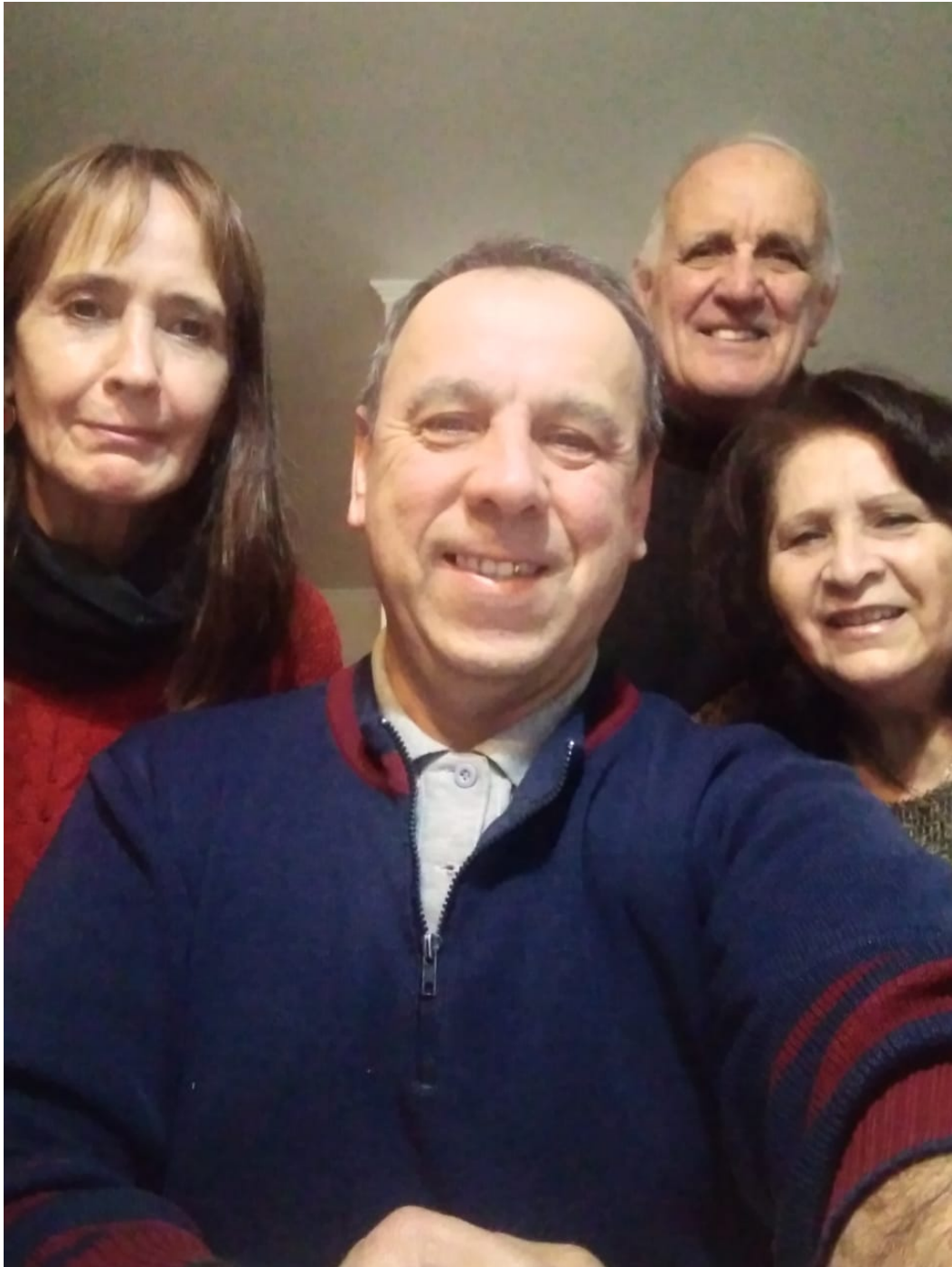
De izquierda a derecha GUARDANDO FUERZAS LA PM, DONDE QUIERAS LA PM, VENCER PRIMERO LA PM Y UN TRATO AMABLE LA PM. Casa Tseyor Maquehue. Araucanía-Chile.