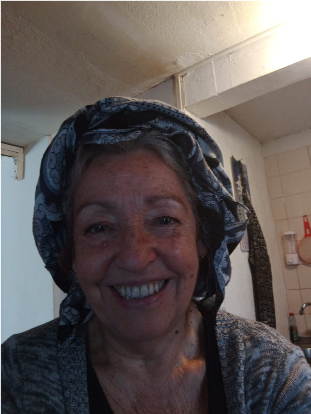
FRUTO DEL CASTAÑO PM ANDANDO PM