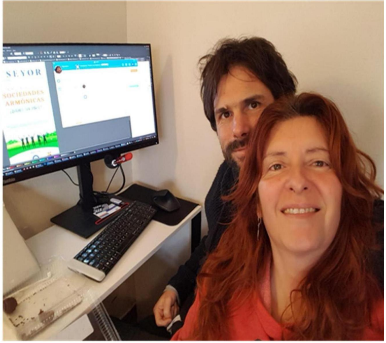
NO A LA TUN TÚN LA PM Y XAMAN ELENA. Derecha: PIGMALIÓN Y CAPITEL PI PM.