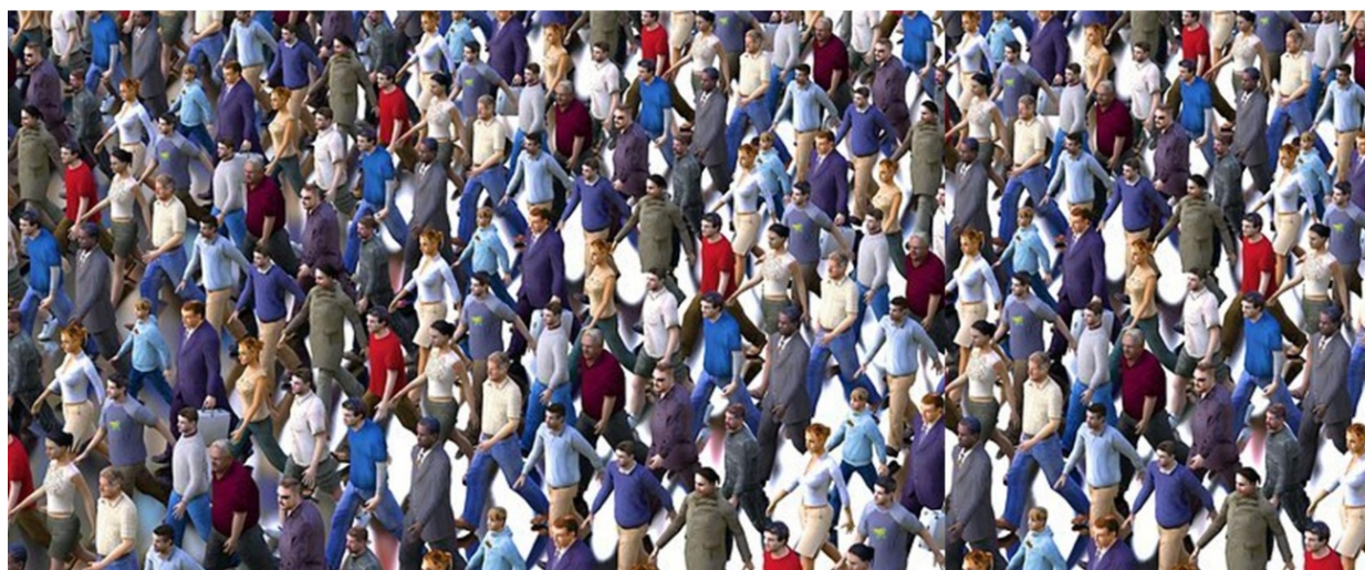
Alegoría del rebaño revuelto

“Ahí el rebaño también está revuelto, está temeroso, vive con unas ansias y una sensación de fatiga, de ahogo, de inseguridad. Y obviamente temeroso porque, además de instinto tiene intuición, o eso parece. Además de instinto e intuición tiene inteligencia, y las ve venir.