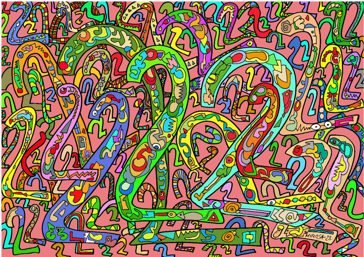
Puzle de FractalOm 15 2. Sayab