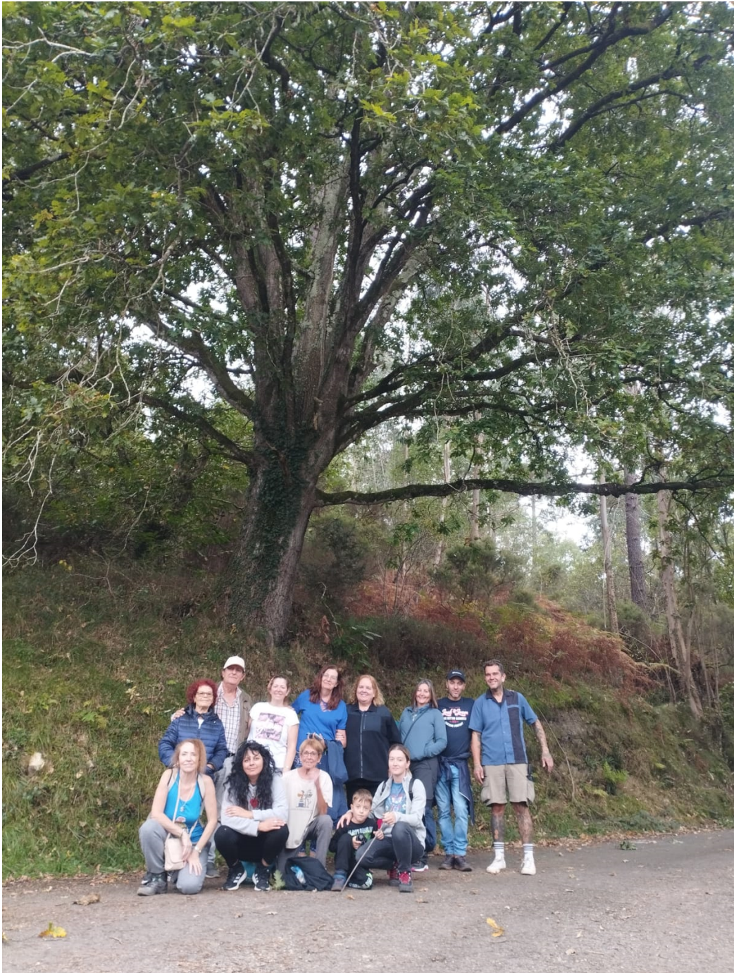
Bajo un roble centenario

1 Recientemente se ha propuesto la idea de que la etimología de Asturias proviene de un acrónimo formado por ASTER y RIAS, que dio lugar a Asturias, como lugar donde hay varios estuarios de ríos que desembocan en el mar.