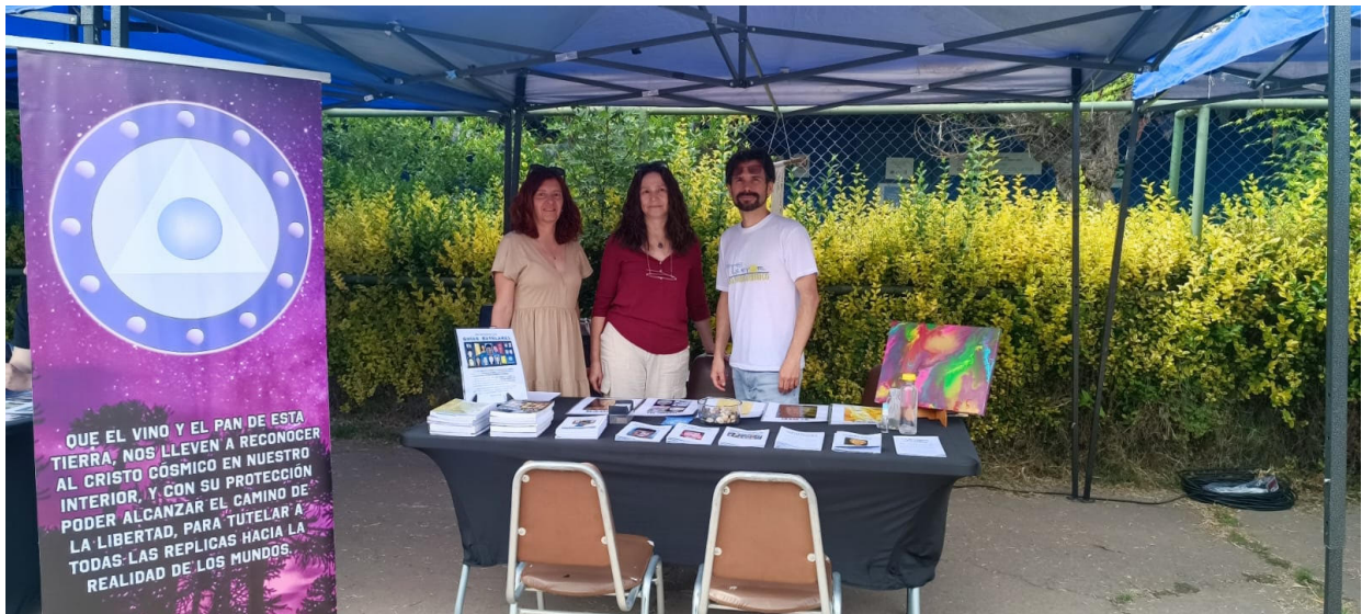
Municipalidad de Quinta Normal: https://www.quintanormal.cl/municipalidad/