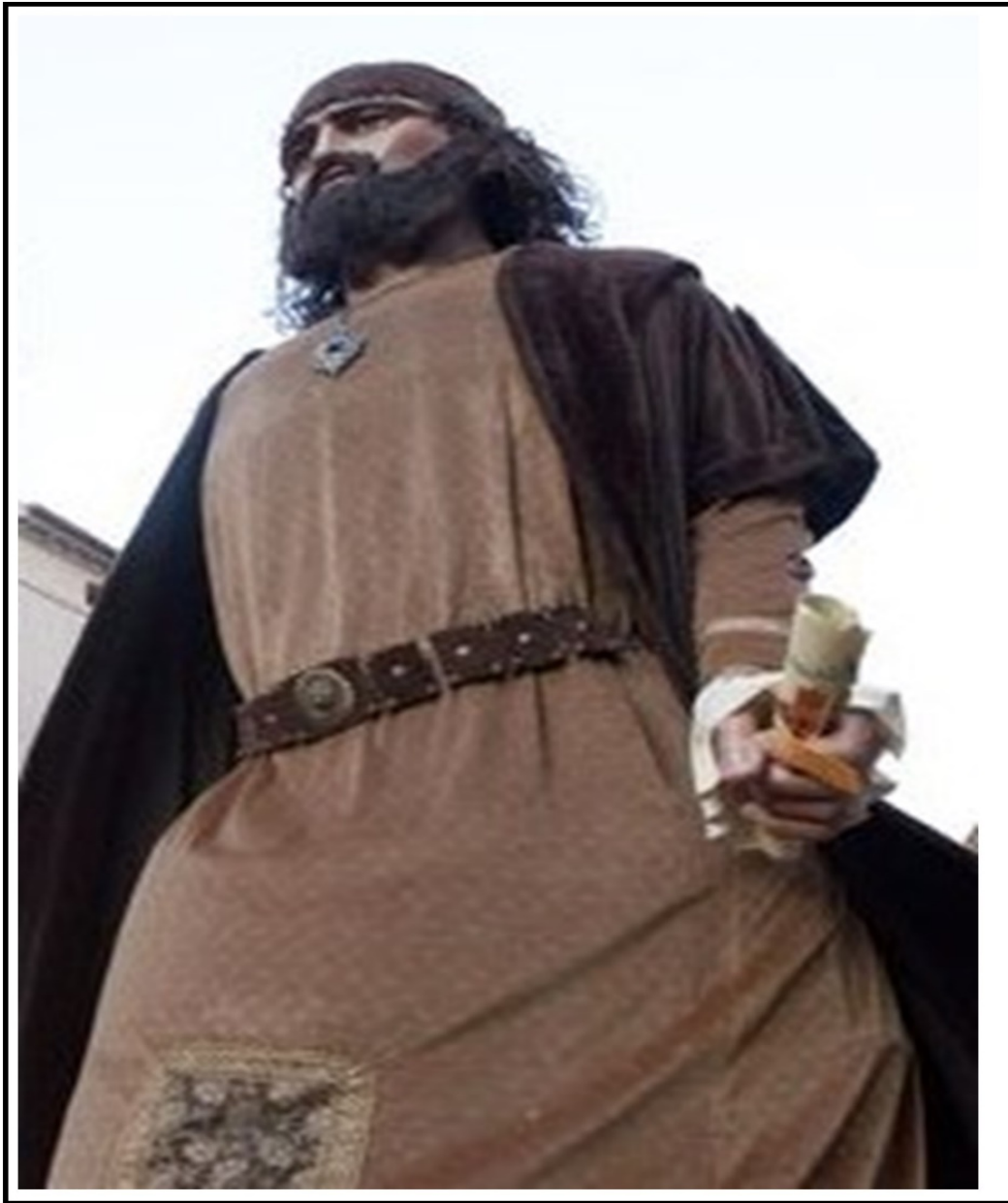
DE LA CULTURA POPULAR TERRASSA-BARCELONA GIGANTE DE 4 METROS DE ALTURA

1 TAP 156, Shilcars: “En este punto, y ya refiriéndome al Muulasterio Tseyor Los Castaños, en Chile, como puerta interdimensional, conectada con la Araucanía, y muy vinculada la Casa Tseyor de Maquehue, y en prolongación con ese maravilloso paraíso que existe en Tierra del Fuego, en la Patagonia, en pleno corazón de la Patagonia, allí va a celebrarse, en un momento determinado, que ya está determinado y ya es, pero que aparecerá tarde o temprano, y más bien temprano en el mundo de los efectos, la realidad también de un proceso creativo sin par. Allí nos quedan las huellas de los Pies Grandes, como se conoce por la gente humilde y sencilla, pero muy abierta y despierta a los mundos internos. Allí existieron los gigantes, seres de gran estatura y mayor corazón amoroso, que obviamente residieron por esa zona y que