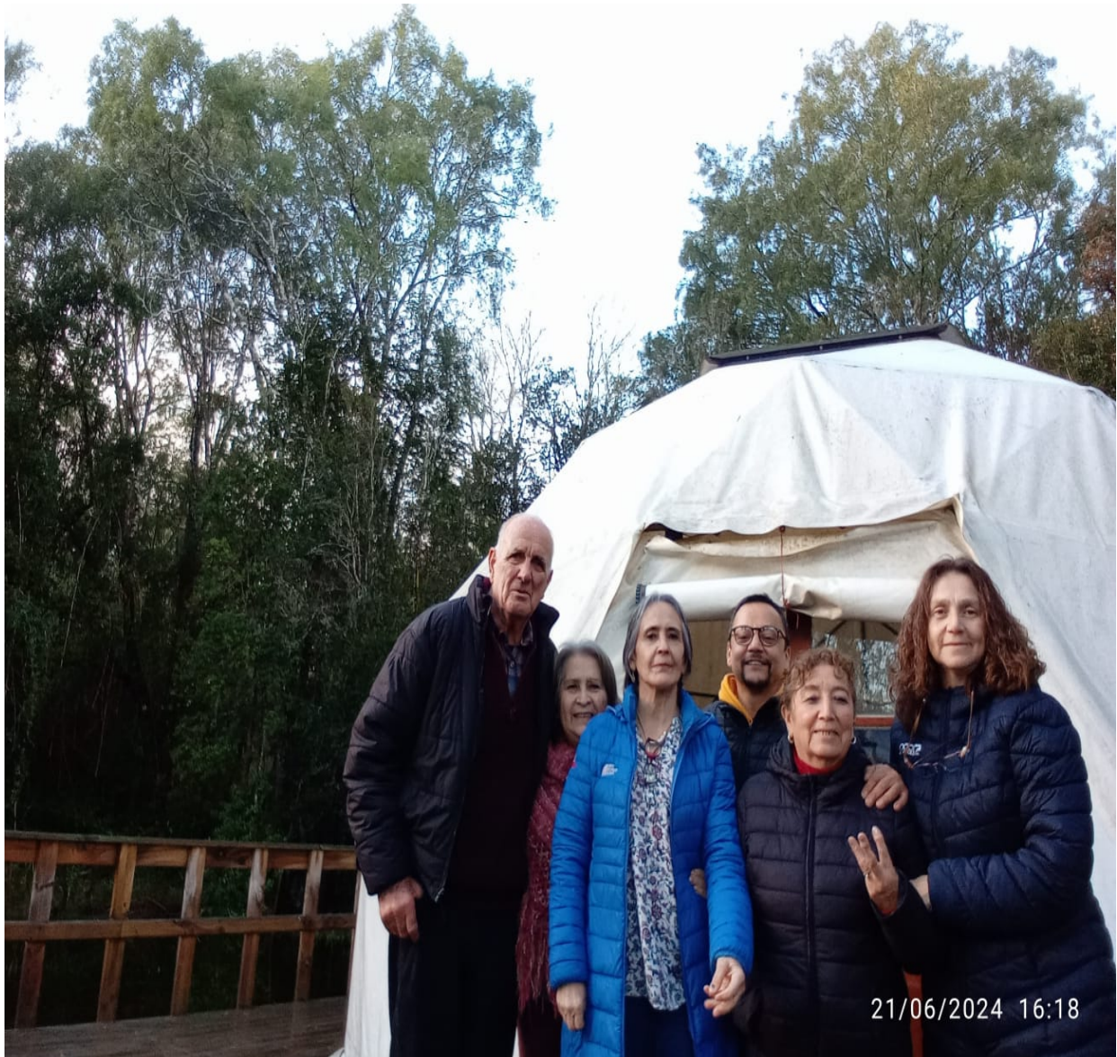
Hermanos y hermanas de Casa Tseyor Maquehue en la puerta del domo