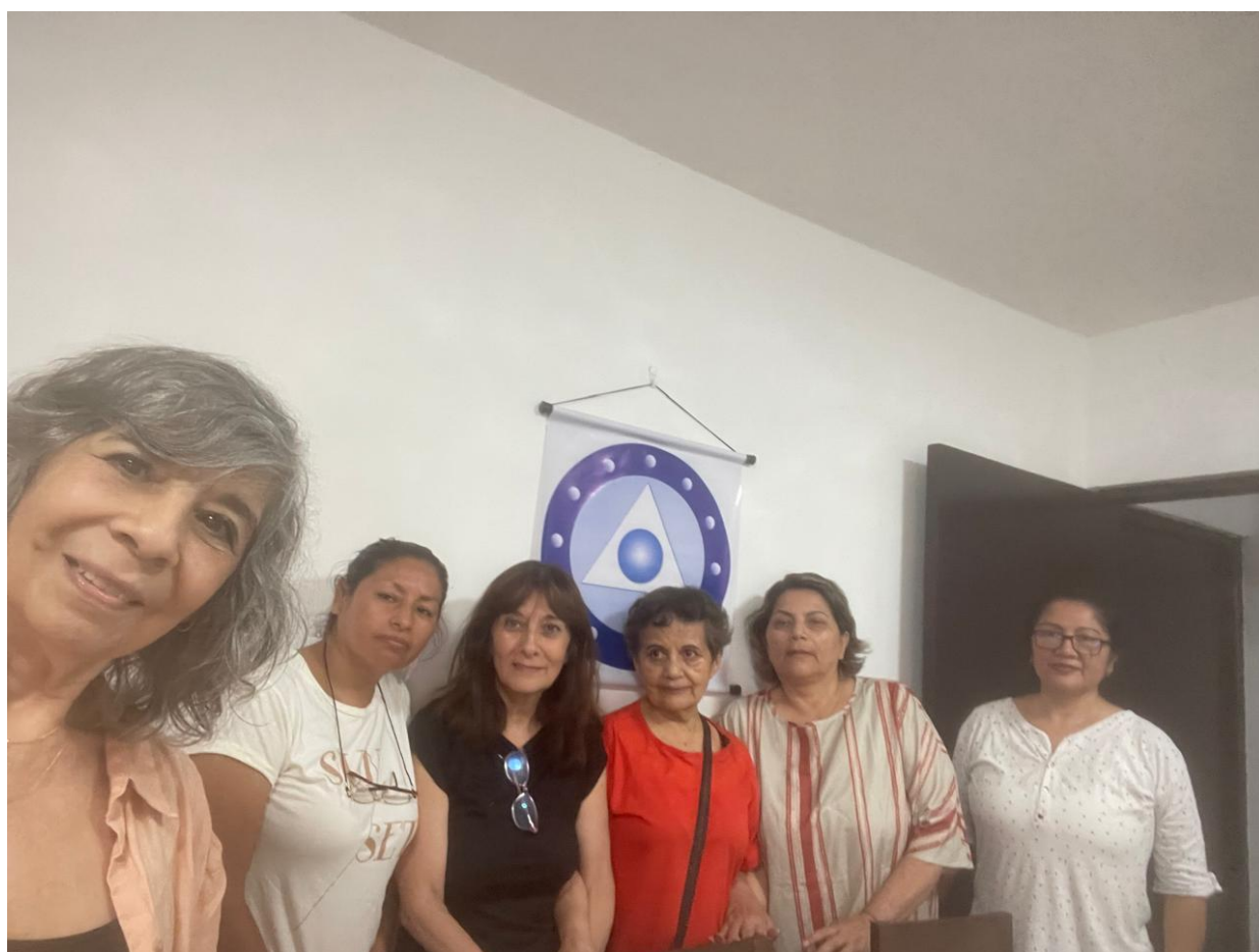
Hermanas de las Casa Tseyor en Perú, con su Belankil Noventa Pm