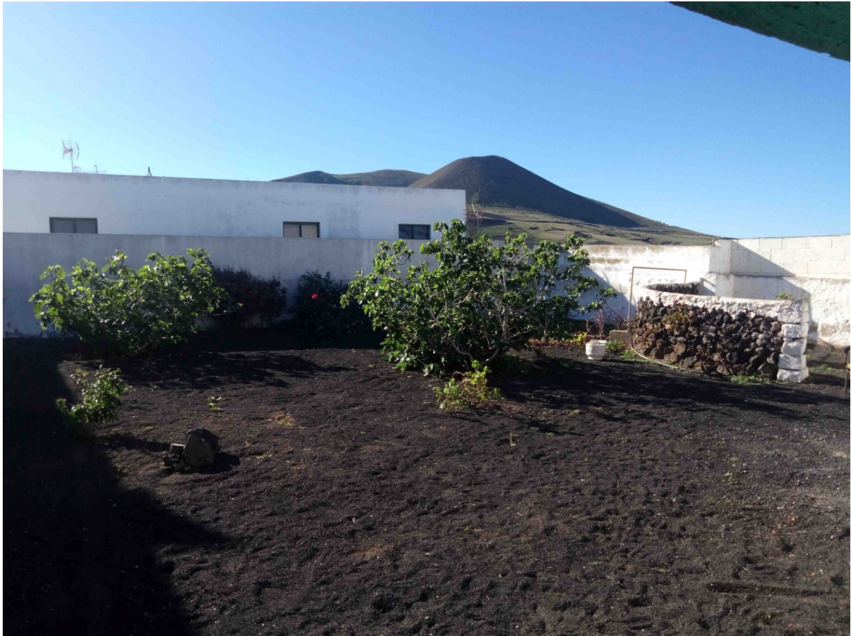
Muulasterio Tegoyo. Huerto con los rosales y la higuera