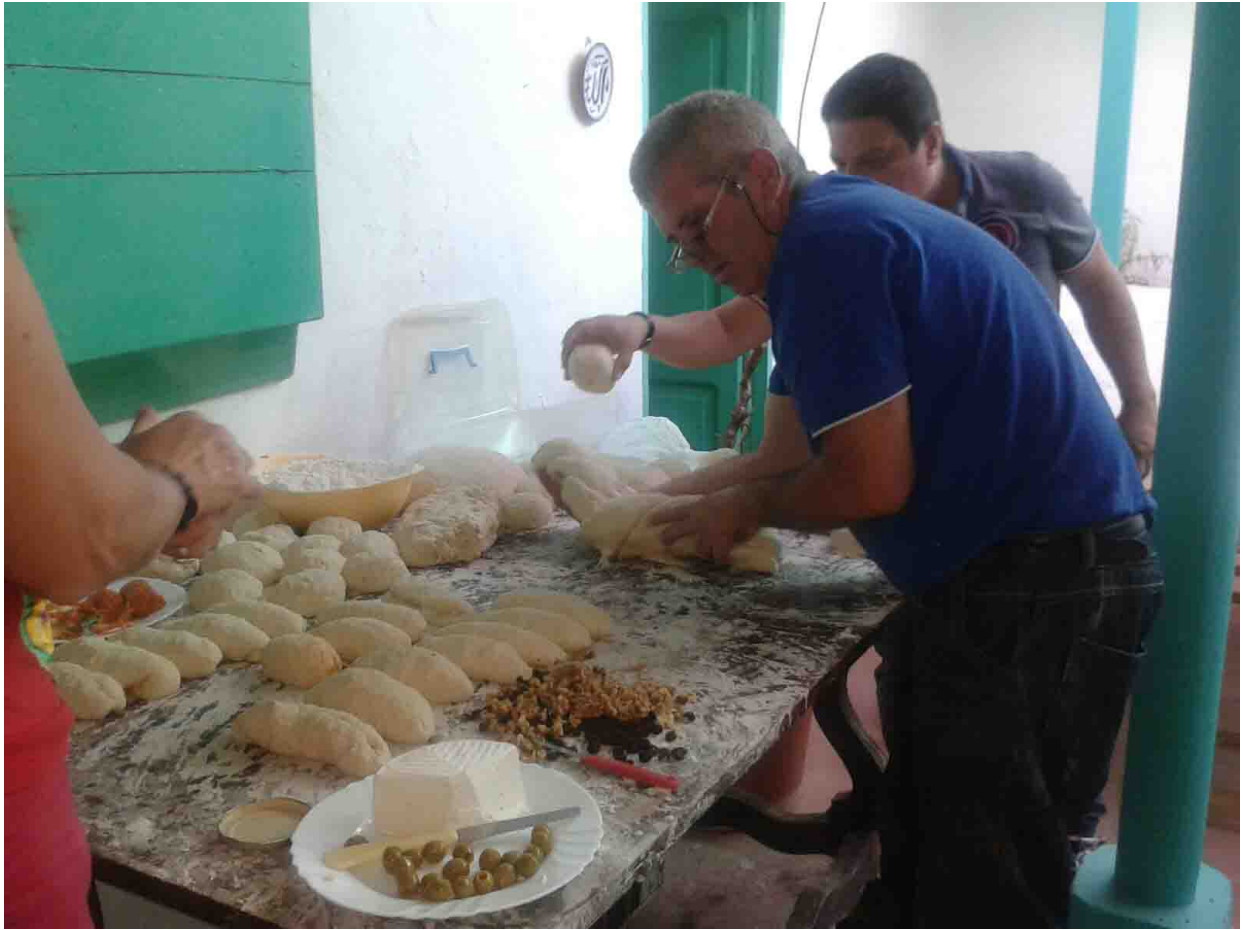
Muulasterio Tegoyo. Responde Siempre La Pm, elaborando el pan