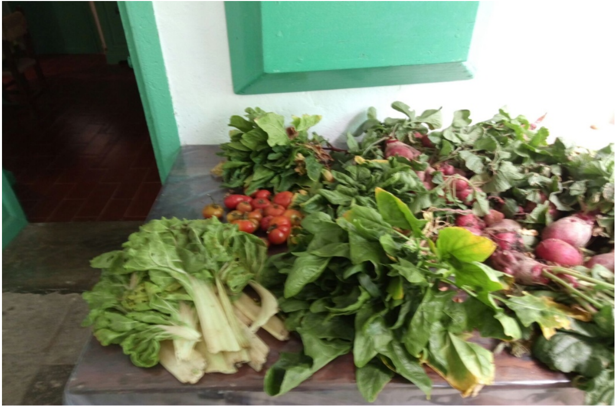
Primera cosecha en el Muulasterio Tegoyo